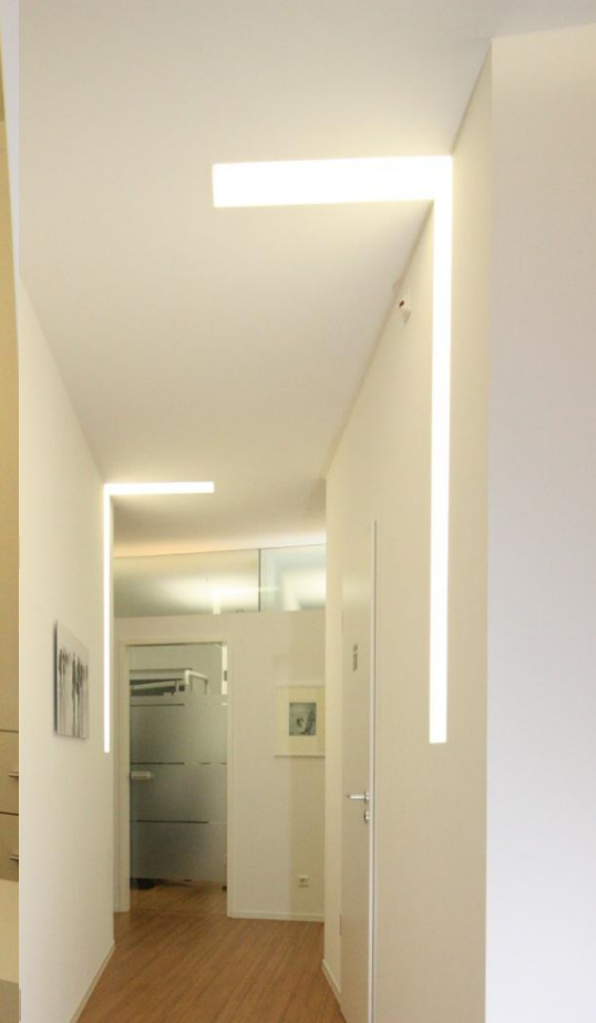
© 2008 Gustav Rennertz & Peter Steiner GbR