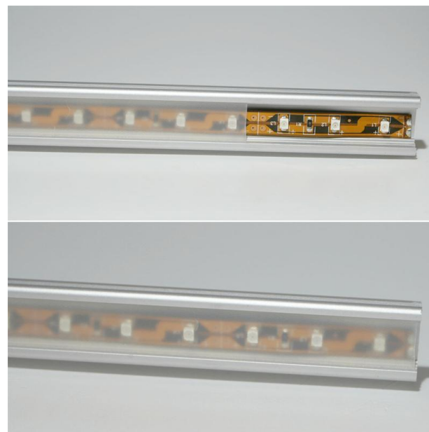
Aluminiumkanal Mit Plexiglasabdeckung