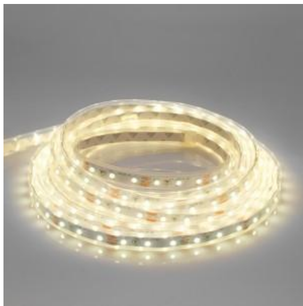
LED Lichtband warmweiß