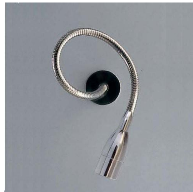
TYP FLEX LED