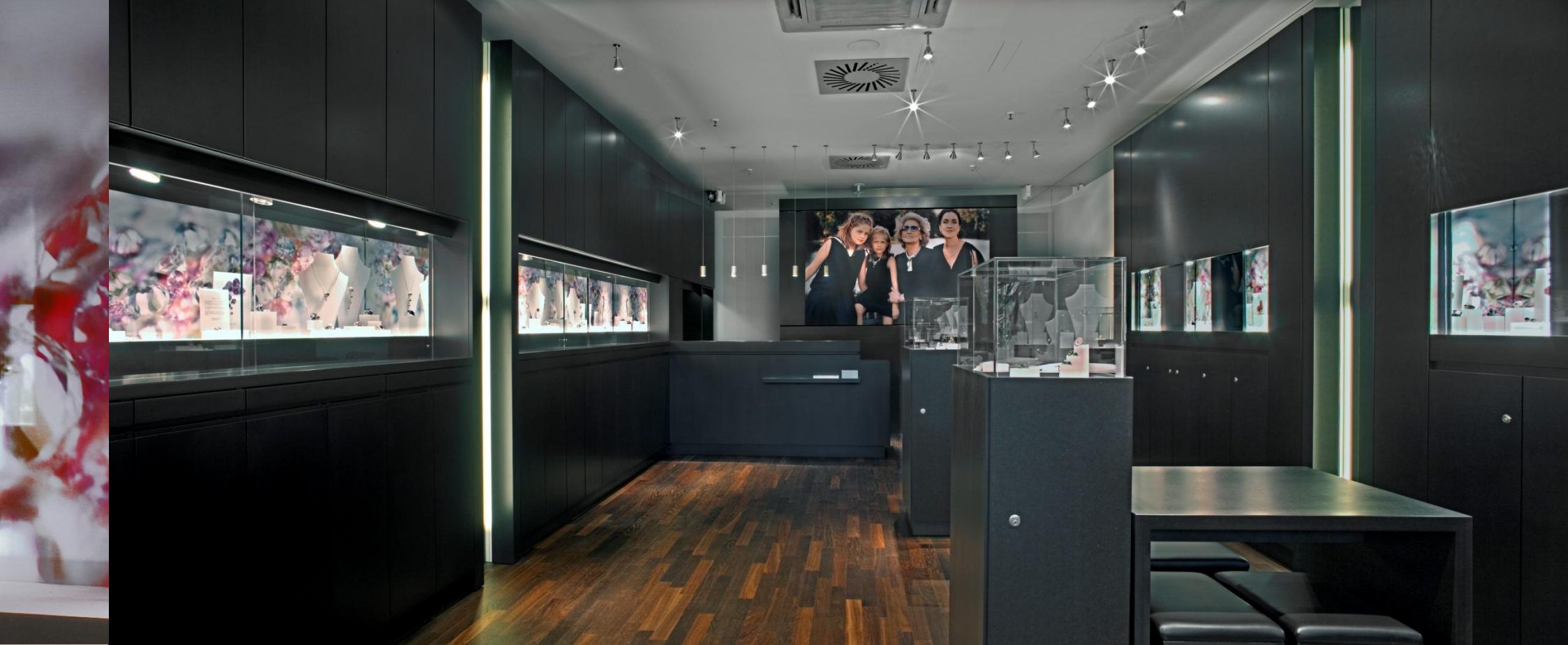
© 2008 Gustav Rennertz & Peter Steiner GbR Ladendesign Fa. Ehinger-Schwarz GmbH & Co. KG Ulm

Bereich Handel/Einzelhandel Charlotte-Standort Breuningerland Ludwigsburg